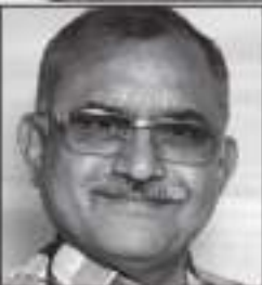
શામજી આસદીર ગડા

પહેલું સ્ટોપ : પાનેરી - અંધેરી બીજું સ્ટોપ : પનીહારી - સાંતાક્રુઝ