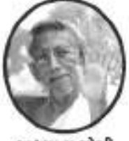
બ્રહ્મચાર્ય શ્રીગી આ.દે. શ્રીમદ્ વિજય કલાપૂર્ણસૂરિશ્વરજી મ.સા.

॥ શ્રી પદ્મ-જુત-હિર-કનક-દેવેન્દ્ર-કચન-કલાપૂર્ણ-કલાપ્રભ સૂરિભ્યો નમઃ ॥