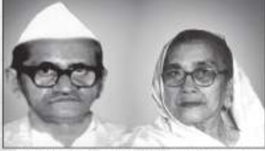
માતુશ્રી લક્ષ્મીબેન ગોપાલજી શીવજી ગડા